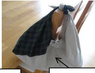
椅子にかけてもお洒落

そのままモノを収納して携帯入れ物として、お買い物の袋として。そしてバッグの中に入れるインナーバッグとして、旅行用の分類袋として。一枚お持ちいただくと、様々なシーンで必ずお役に立つことでしょう。大切な方への贈り物、そして日本の道具の美しさを伝えることができる海外の手土産としてもご利用いただけます。清楚な花柄でお化粧したピンクやグリーンの器と共に、ご自用、贈り物用のいずれにもぴったりです。全部で11種類。