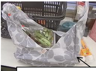
(大)タイプならお買い物袋に

③ H16116300-321 彩圖 盛鉢 3,150円 (本体価格3,000円) [実用型] 縦: 19.5x17.5cm 全長: 15.5cm 幅: 11.5x11.5cm 全長: 10cm 中国製 全16入 (0107)